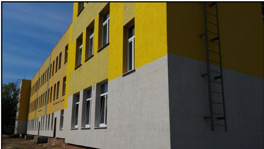
Детский сад «Крепыш»