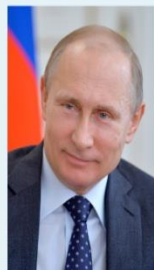
В.В. ПУТИН, Президент Российской Федерации

«Национальные проекты призваны объединять граждан для достижения прорыва. Это необходимо на поворотном, рубежном этапе истории нашей страны».