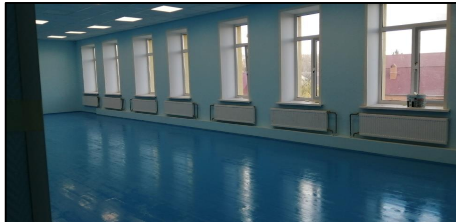
Ремонт помещений в детском саду «Сказка»